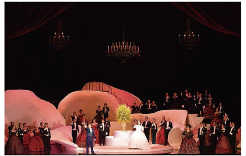
2023年7月東京公演より

パリの社交界に咲いた一輪の椿—— 絢爛豪華な舞台と衣裳で魅せる、 ジュゼッペ・ヴェルディ不朽の名作悲劇