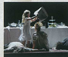
(ネザーランド・オペラ公演より)