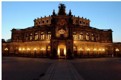
ゼンパーオーパー・ドレスデン