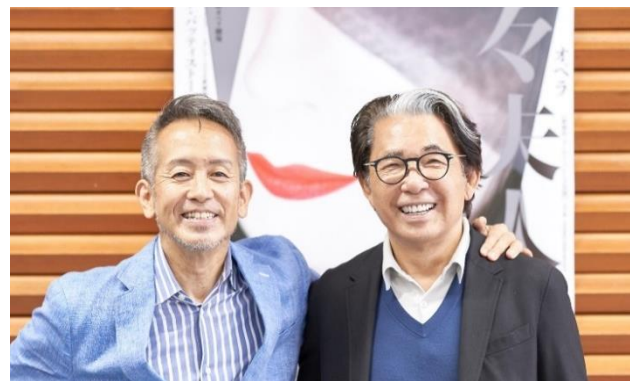
2019年新制作記者会見より 左から宮本亜門、高田賢三