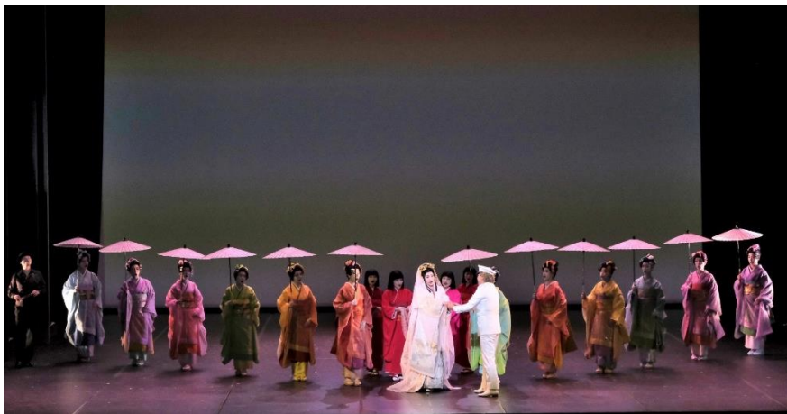
2019年公演より

2020年10月、衣裳デザインの高田氏が新型コロナウイルスによる合併症により、パリ郊外で亡くなりました。「憧れ」と語っていた『蝶々夫人』の衣裳は、世界のファッション界に数多の業績を残した氏の、最後の仕事のひとつとなりました。私どもは、この『蝶々夫人』上演を通して、その美しい衣裳の数々を多くの方にご覧いただきたいと願っております。