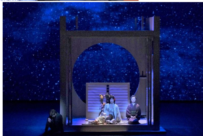
2019年東京ワールドプレミア公演より