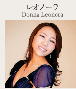
イ・スンジェ Lee Soon Jae