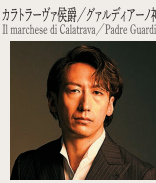
後藤春馬 Kazuma Goto