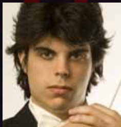
指揮: アンドレア・バッティストーニ Conductor: Andrea BATTISTONI