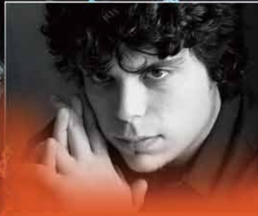
イタリア・オペラの若き王者、 バッティストーニ、都響と初共演!