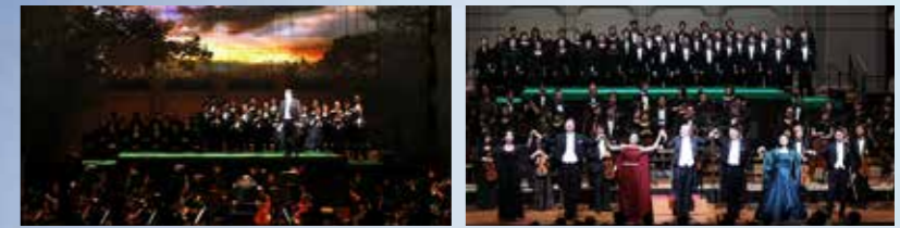
(2018年3月 東京二期会コンチェルタンテ・シリーズ「ノルマ」公演より)

「ボヴァリー夫人」のギュスターヴ・フロベールが描いた悲劇が、ジュール・マスネによって、 壮麗なグランド・オペラに仕立てられた。19世紀後期の稀代のメロディストが放つ、 極上のアリアの数々をフランスの至宝、ミシェル・プラッソンが導く!!