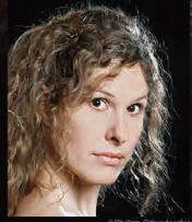
演出:ロッテ・デ・ベア Stage Director: Lotte de Beer