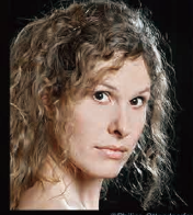
演出: ロッテ・デ・ベア Stage Director: Lotte de Beer