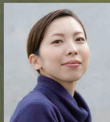
© 前澤秀登 演出：中村 蓉 Stage Director: Yo Nakamura