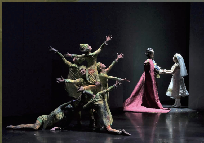
2021年5月 二期会ニューウェーブ・オペラ劇場公演『セルセ』より 指揮：鈴木秀美 演出：中村 蓉

装置：原田 愛 Set Designer: Ai Harada 衣裳：田村香織 Costume Designer: Kaori Tamura 照明：喜多村 貴 Lighting Designer: Takashi Kitamura