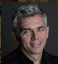
演出・衣裳: ロラン・ペリー Stage Director & Costume Designer: Laurent Pelly