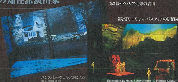
ハンス・シャヴェルノホによる舞台装置模型

20世紀最大の演出家であるジャン＝ピエール・ポネルの助手として頭角を現し、1975年より自らも演出を手がける。1986年から89年までパリ・オペラ座総裁を務める。作品そのものの魅力に真摯に向き合い、緻密な時代考証に裏づけされた説得力のある演出が高く評価され、前衛的で奇抜な演出がもてはやされる風潮の中、改めてその存在が重要視されている。パリを拠点にサンゼリゼ劇場、マルセイユ歌劇場、グラーズ歌劇場の他、フランス、ドイツを中心に活躍している。