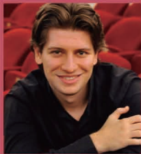
[指揮]ダニエレ・ルスティオーニ Conductor: Daniele Rustioni