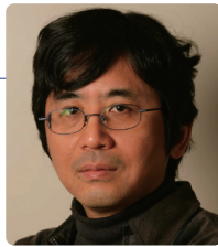
演出 嶋山 仁 Stage Director: UYAMA, Hitoshi

管弦楽: 東京交響楽団 Orchestra: Tokyo Symphony Orchestra