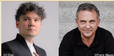
指揮:エリ阿斯・グランディ 演出:アンドレアス・ホモキ