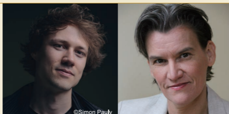
指揮:オスカー・ヨッケル 演出:カロリーネ・グルーバー