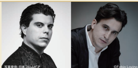
指揮:アンドレア・パッティストーニ 演出:ダミアン・ミキエレット