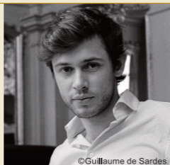
指揮:マキシム・パスカル