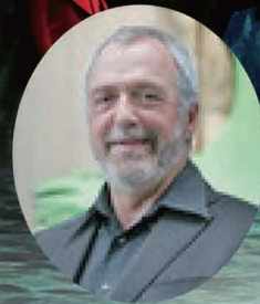
【演出】 ヴィリー・デッカー Stage Director: Willy DECKER